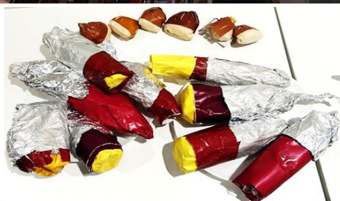
創作活動 焼き芋・栗