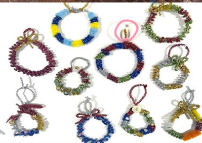
創作活動 クリスマスモールリース