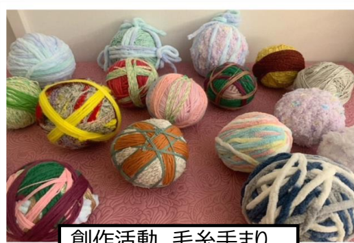
創作活動 毛糸手まり