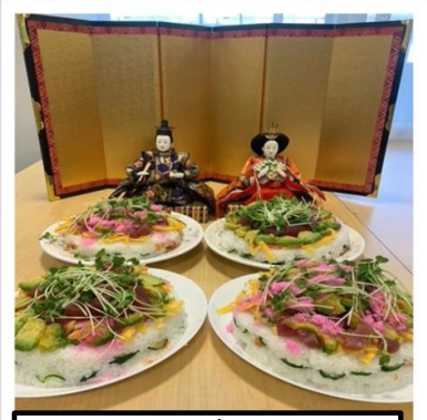
調理 ちらし寿司ケーキ